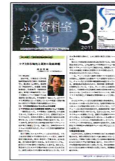
ふく資料室だより