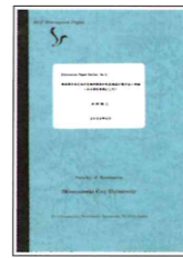
ディスカッション・ペーパー