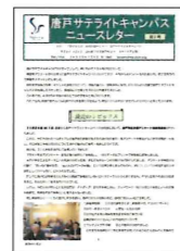
唐戸サテライト キャンパス